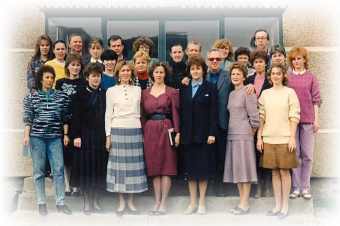
Kolektív učiteľ'ov šk. roku 1990/91