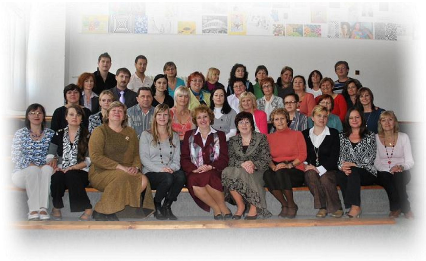
Kolektív učiteľ'ov v šk. roku 2010/2010