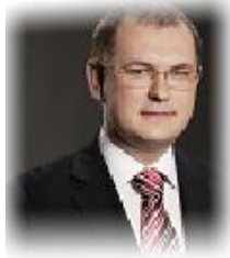
Ing. Marián Saloň, poslanec Národnej rady Slovenskej republiky

Našej jubilatke, jej žiakom, rodičom, učiteľom, zamestnancom i vedeniu chcem do ďalších rokov popriať mnoho úspechov, aby i naďalej bola liahňou šikovných, tvorivých a úspešných ľudí.